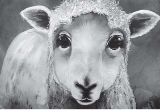
A1902704 „Haus, Hof und Heimat“ - Sehen, erleben und malen!